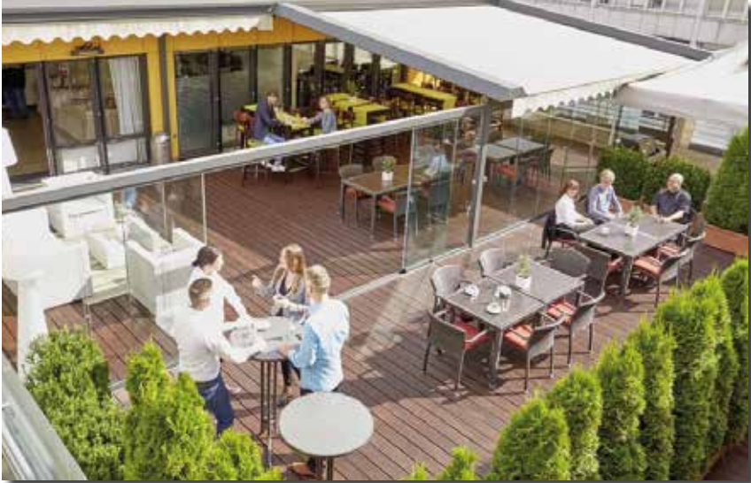
Es kann auch draußen getagt werden