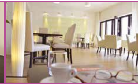
Komfortabel pausieren in der schicken Lounge