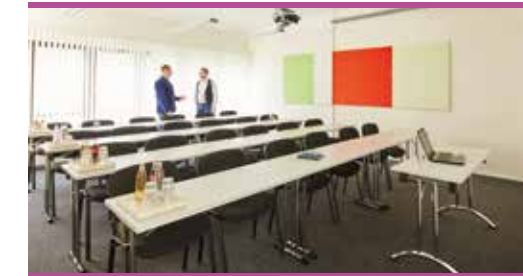
Effizient schulen in funktionalen Räumen