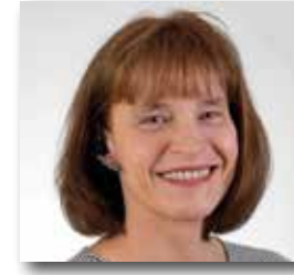
Ich berate und informiere Sie gern!