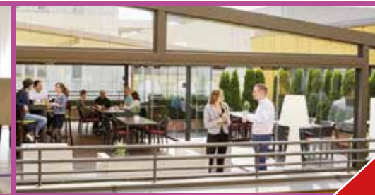
Kraft tanken auf dem Freideck und im Wintergarten

Preiswert mieten und alles inklusiv genießen.