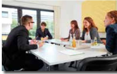
Schulen in entspannter Atmosphäre

Hinweis: Alle Fotos in diesem Prospekt sind original bei uns aufgenommen.