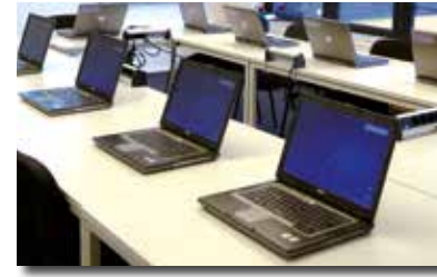
WLAN/LAN (VDSL) für alle auf Wunsch