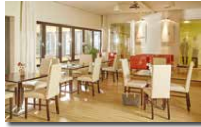
In unserer Lounge-Zone wird aufgetankt und neue Kreativität aktiviert. Kaffee, Wellness-Tee und frisches Wasser stehen kostenlos bereit.