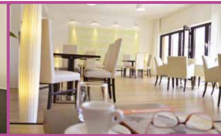
Komfortabel pausieren in der schicken Lounge