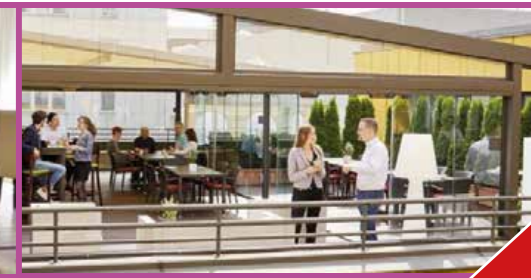
Kraft tanken auf dem Freideck und im Wintergarten

Preiswert mieten und alles inklusiv genießen.