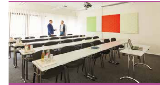
Effizient schulen in funktionalen Räumen